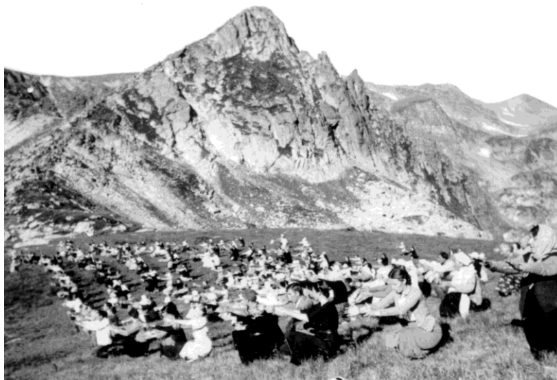
Изпълнение на гимнастически упражнения на Рила планина