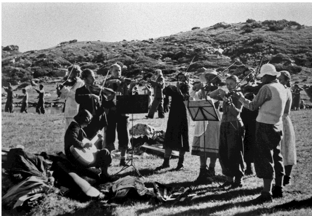
Паневритмия на Рила планина в присъствието на П. Дънов.

Музиката, движенията и някои от текстовете на песните на паневритмията са резултат от дългогодишна работа на П. Дънов. От 1922 г. той създава някои от песните, които по-късно стават част от упражненията от първия дял на паневритмията. Все пак в по-голямата си част упражненията на първия дял започват да се оформят като съчетание от музика и движения и да се практикуват общо не по-късно от 1932 г. (Савова, 2002, с.34).